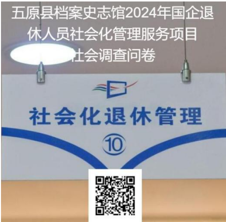
第1题 您的性别？ [单选题]

您好，我司受五原县财政局委托，就五原县档案史志馆 2024 年度国企退休人员社会化管理服务项目向您进行满意度问卷调查，感谢您的支持与配合！